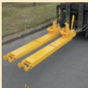
Montaje rápido sobre horquillas