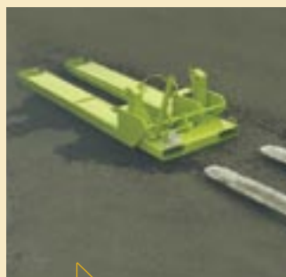
Después: innovación basculador BP