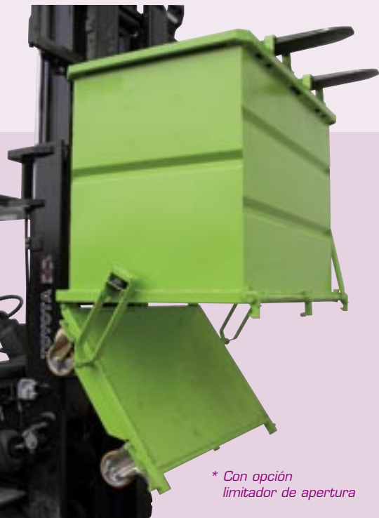
* Con opción limitador de apertura

2 versiones de bloqueo sobre horquillas (antideslizamiento).